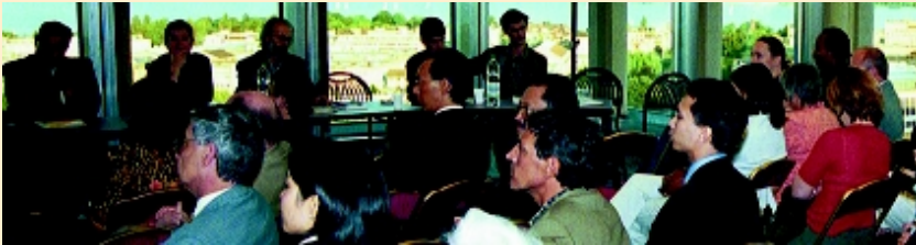
Mesa redonda sobre la música tradicional.

En el marco de su colaboración con el Festival de la Bâtie, la OMPI organizó el 5 de septiembre una mesa redonda para abordar las cuestiones de propiedad intelectual que plantea el creciente acercamiento entre músicos tradicionales y contemporáneos de todo el mundo.