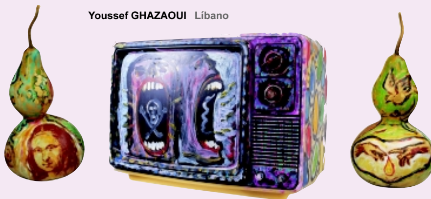
Youssef GHAZAQWI Líbano