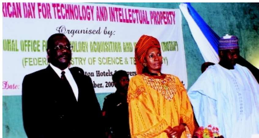
Celebración de la Jornada Africana de la Propiedad Intelectual en Nigeria.

El año pasado, la Organización de la Unidad Africana (OUA) declaró que a partir de esa fecha se celebraría cada 13 de septiembre la Jornada Africana de la Propiedad Intelectual y la Tecnología. La cooperación entre la OUA y la OMPI para promover las invenciones y la creatividad en África se remonta a los años 80. Ambas organizaciones colaboraron también para promover la primera celebración de la Jornada Africana de la Propiedad Intelectual este año.