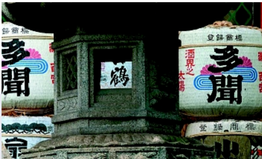
Templo sintoísta, Kobe (Japón).

En cuanto al fondo en fideicomiso para actividades en el campo del derecho de autor, en 1999-2000 los fondos se utilizaron para organizar varias actividades en los planos regional, subregional y nacional en Asia y el Pacífico. En un simposio regional organizado en Nueva Delhi (India), en diciembre de 1999, se abordó la estrategia y la metodología para una observancia eficaz del derecho de autor y los derechos conexos y se examinó la última actualidad importante a ese respecto en el ámbito internacional. En otro seminario subregional organizado en Apia (Samoa), el pasado mes de agosto, se hizo hincapié en una toma de conciencia acerca de la protección del derecho de autor y los derechos conexos y acerca de la función que pueden desempeñar esos derechos en el desarrollo cultural y económico de los países del Pacífico Sur. A ese seminario siguió un taller sobre la