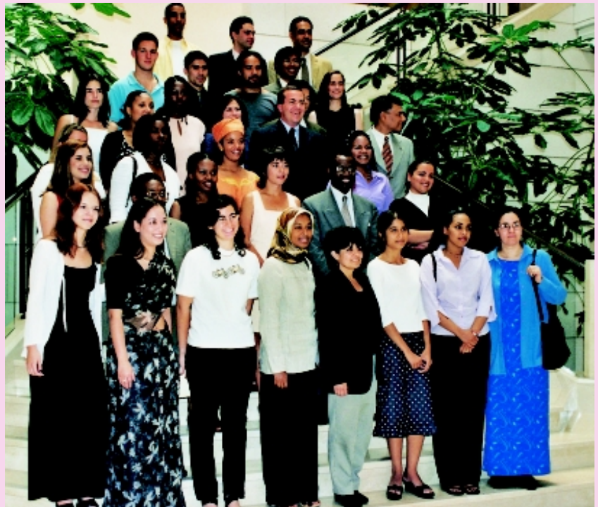
Entrega de diplomas a los participantes en la sesión de verano de la Academia de la OMPI.