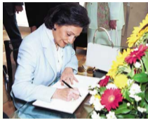
La Primera Dama de Egipto, Sra. Suzanne Mubarak, firma el Libro de Visita en el Centro de Información de la OMPI.

La Sra. Mubarak se dedica a actividades de promoción del respeto de la propiedad intelectual en un grupo clave de la población, los niños y jóvenes. Los niños crecerán y se convertirán en los científicos, inventores, artistas y músicos del mañana, todos ellos dependientes del