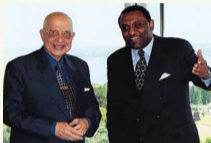
El Secretario General de la Liga, Dr. Ahmad Essam Abdel Meguid y el Dr. Karim Idris.

El Dr. Idris felicitó asimismo al Senegal por la labor de sensibilización sobre cuestiones de propiedad intelectual a nivel regional, que desempeña desde hace tiempo.