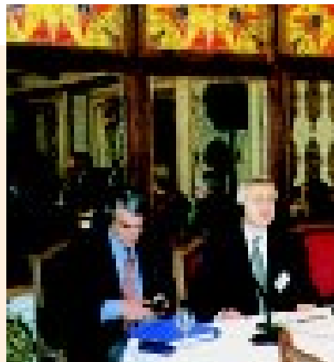
Los participantes en el seminario agradecieron el enfoque práctico adoptado para tratar de los temas

Gran parte de los debates se centró en las técnicas de negociación de concesión de licencias y en particular la dificultad de mantener la distancia profesional en las relaciones que tienen por fin la concesión de licencias a un empleado (cuando se trata de su trabajo) que está siendo examinado.