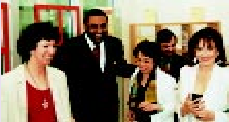
El Dr. Idris en la inauguración de la nueva exposición de la OMPI La invención en su hogar

Un espacio de 60 metros cuadrados del Centro de Información de la OMPI se ha transformado en un apartamento como parte del objetivo de la OMPI de desmitificar la propiedad intelectual. La exposición demuestra asimismo cómo ideas relativamente sencillas que se han convertido en objetos domésticos se han beneficiado de la protección proporcionada por el sistema de protección internacional de la propiedad intelectual. En la mayoría de los casos los creadores de estas obras, que han obtenido beneficios financieros como resultado del sistema de propiedad intelectual, han recibido incentivos para seguir creando innovaciones. El diseño de la exposición es parecido al de un hogar tradicional, y cuenta con una sala de estar, un dormitorio, un comedor, una cocina y un lugar de trabajo. La mayoría de los objetos de la exposición han sido objeto en