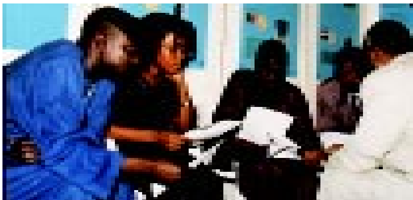
Visitantes de la Feria descubren los servicios que ofrece el puesto de la OMPI

Un jurado de cinco personas eligió a los ganadores de las Medallas de Oro de la OMPI que fueron entregadas a: