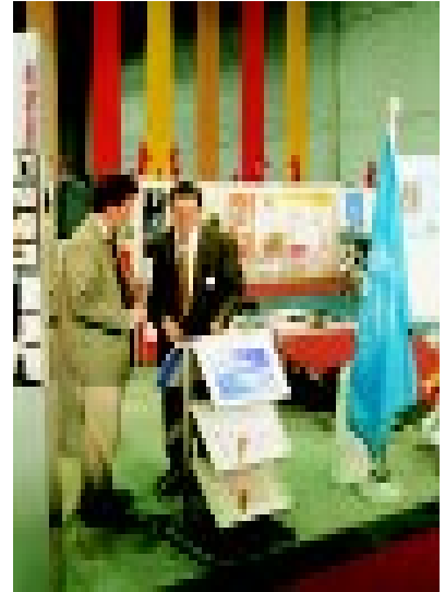
Presentación de la OMPI, y del trabajo de la mujer inventora, al público

Este año un jurado internacional otorgó dos Medallas de Oro de la OMPI a nacionales de Malasia y Sri Lanka.