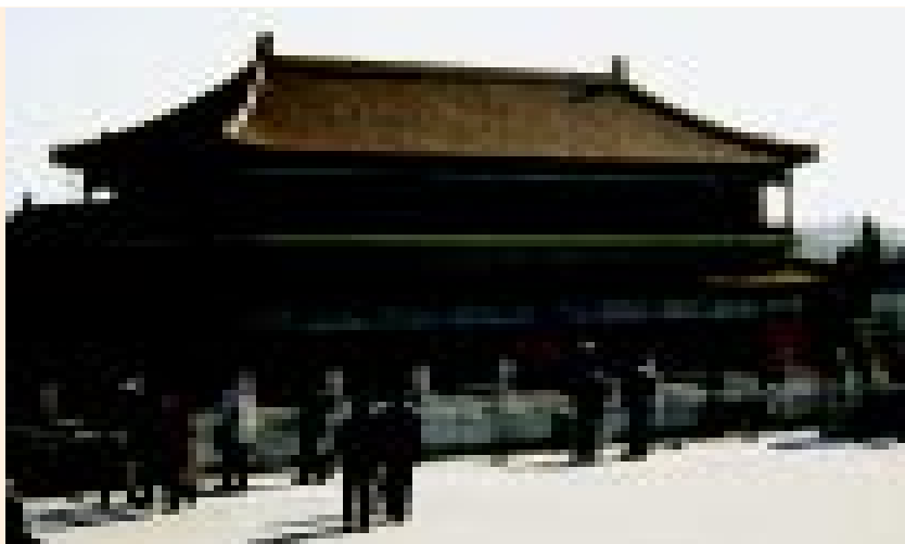
Vista de la Ciudad Prohibida

El simposio atrajo gran atención principalmente debido al contenido de sus temas y a su oportunidad. Los participantes estuvieron de acuerdo en el papel indispensable que seguirán desempeñando las universidades e instituciones de investigación en el sistema de propiedad intelectual y la manera en que aumentará su importancia a medida que sigue desarrollándose la "era de la información" y la "economía basada en el conocimiento".