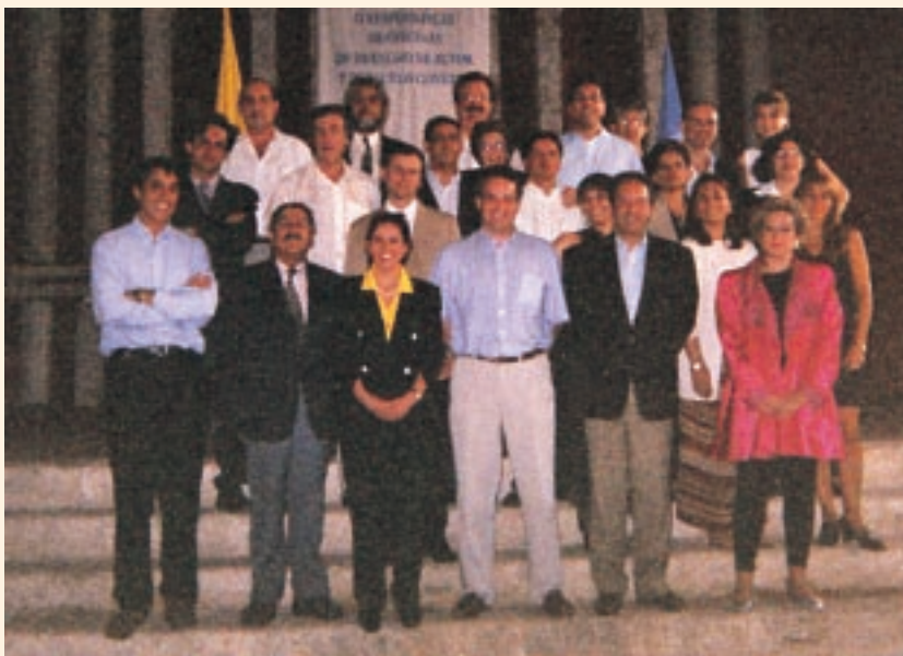
Participantes de las dos reuniones regionales de directores de las oficinas de derecho de autor

A la reunión asistieron directores de 16 países latinoamericanos, cada uno de los cuales pronunció una conferencia sobre la situación del derecho de autor en su país. La reunión versó asimismo sobre el programa de cooperación para el desarrollo de la OMPI para los países latinoamericanos y las actividades futuras que se llevarán a cabo en la región.