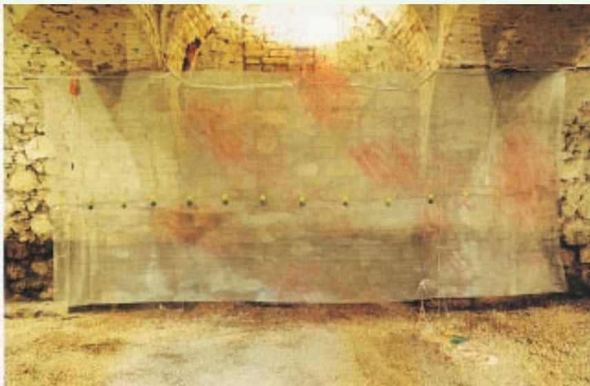
“Libertad” de Emanuela Lucaci.

Del 26 de marzo al 17 de abril, la OMPI, en colaboración con la Oficina del Alto Comisionado de las Naciones Unidas para los Derechos Humanos, conmemora el 55º período de sesiones de la Comisión de Derechos Humanos con una exposición titulada “Libertad”, de la artista rumana Emanuela Lucaci. Los cuadros e instalaciones artísticas fueron expuestos en el Palacio Wilson de Ginebra, que alberga la Oficina del Alto Comisionado.