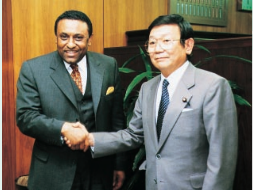
El Director General se reúne con el Sr. Kaoru Yosano, Viceministro de Asuntos Internacionales

El Ministro del MITI, Sr. Kaoru Yosano, expresó el firme apoyo del MITI y de la JPO a las actividades presentes y futuras de la OMPI. Mencionó asimismo los modos en que podría mejorarse el PCT, a fin de beneficiar a los solicitantes de todos los Estados miembros del Tratado, incluidos los países en