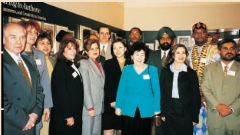
Participantes del seminario mundial, celebrado en Wáshington, D.C.

Durante las sesiones del seminario, los funcionarios de la OMPI pronunciaron alocuciones sobre los tratados en materia de derecho de autor y derechos conexos, así como sobre el Programa de Cooperación para el Desarrollo de la OMPI. Los oradores de la oficina estadounidense de derecho autor pronunciaron