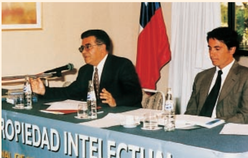
La OMPI se centra en la observancia de los derechos en Chile

La reunión constituyó un foro excelente para el intercambio de experiencias nacionales en la esfera de la protección del derecho de autor y numerosos participantes volvieron a sus lugares de origen con planes concretos para mejorar sus sistemas nacionales de administración.