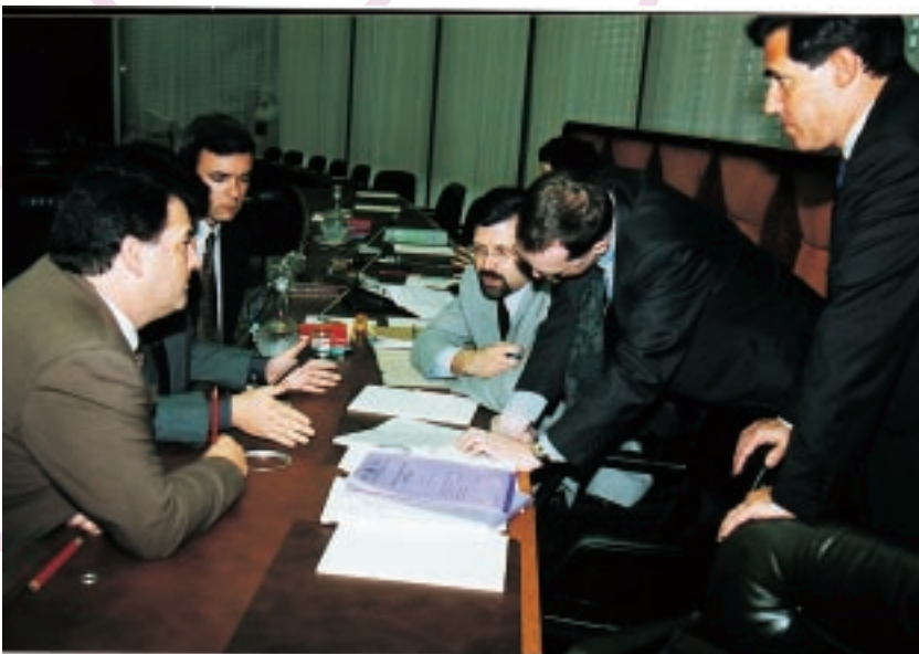
Se alcanzó un acuerdo sobre cuestiones clave para un proyecto de resolución sobre marcas notoriamente conocidas

A la reunión asistieron delegaciones de 71 Estados miembros y las Comunidades Europeas, dos organizaciones intergubernamentales y 18 organizaciones no gubernamentales (ONG).