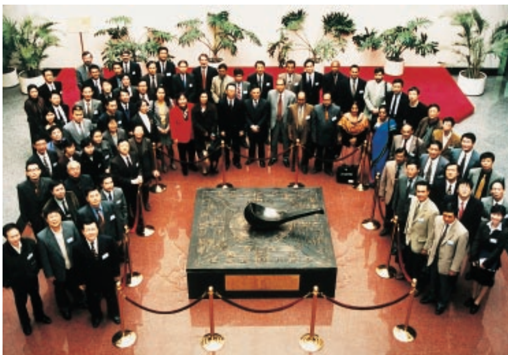
Los participantes del seminario congregados en la suntuosa entrada del nuevo Centro Chino de Formación en materia de Propiedad Intelectual

Bangladesh, Brunei Darussalam, Filipinas, India, Indonesia, Japón, Malasia, Mongolia, Pakistán, Papua Nueva Guinea, República de Corea, República Islámica del Irán, República Popular de China, Singapur, Sri Lanka, Tailandia y Viet Nam.