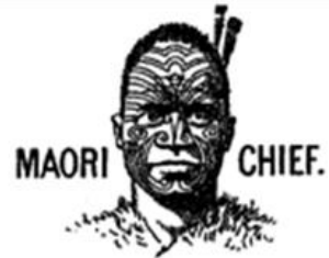
Goods: "butter" (1893)