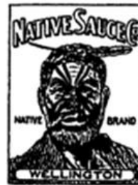
Goods: "Worcester sauce, pickles and chutney" (1927)