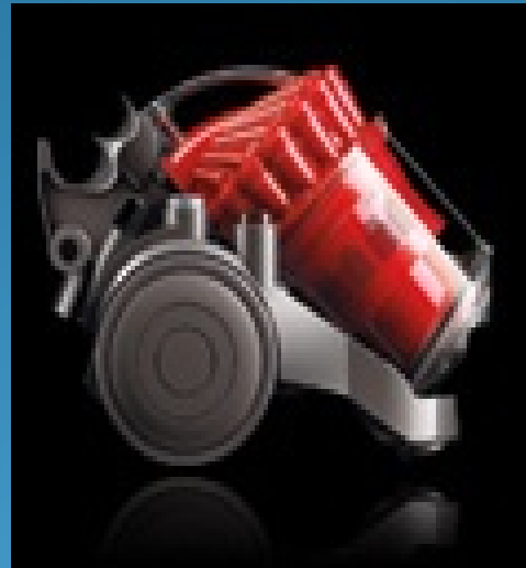
Aspirateur sans sac J.Dyson