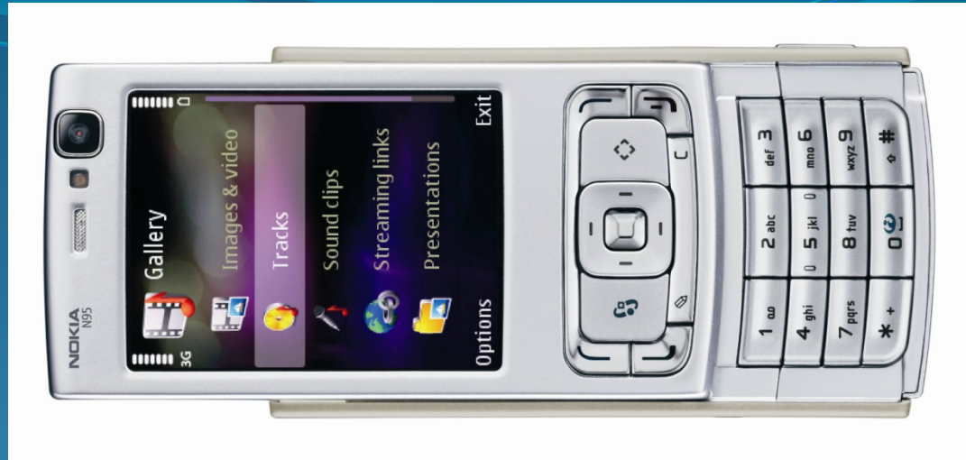
Téléphone portable Nokia