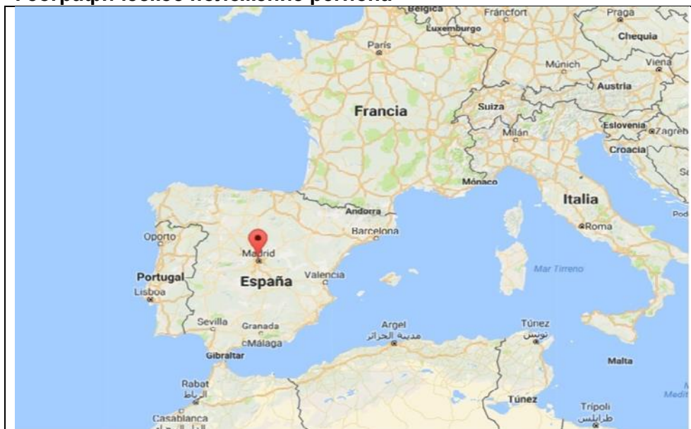
Испания и соседние государства