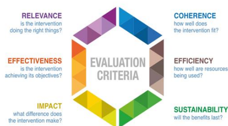
图 1 - 仅英文