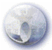
INSTITUTO MEXICANO DE LA PROPIEDAD INDUSTRIAL