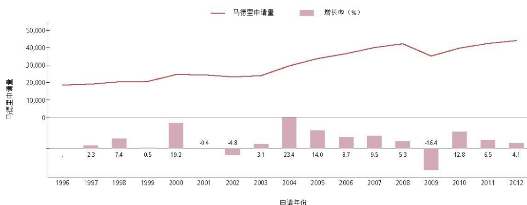
图表 3: 马德里申请的增长情况

13. 商标国际注册马德里体系。 马德里体系正呈现出令人满意的扩展态势。从需求方面来说，2012 年的国际申请量达到了 43,998 的新高，较 2011 年增加了 4.1%。这一趋势在 2013 年的前七个月里继续保持，国际申请量较 2012 年同期增长了 5.9%。