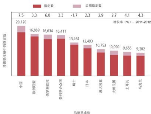
图表 4: 被指定最多的十个马德里成员

15. 在过去 12 个月里, 马德里的成员继续增加, 墨西哥、印度、卢旺达和突尼斯都加入进来。成员总数现在为 92 个。从使国内立法符合马德里体系以及相应调整程序方面的援助要求判断, 我们完全有理由相信这一扩展态势还会继续。