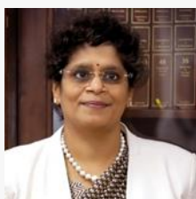
Пратиба М. СИНГХ