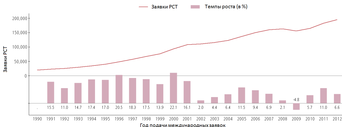
Рис. 1: Динамика в отношении заявок РСТ

Примечание: Данные за 2012 год являются оценками ВОИС Источник: Статистическая база данных ВОИС, март 2013 г.