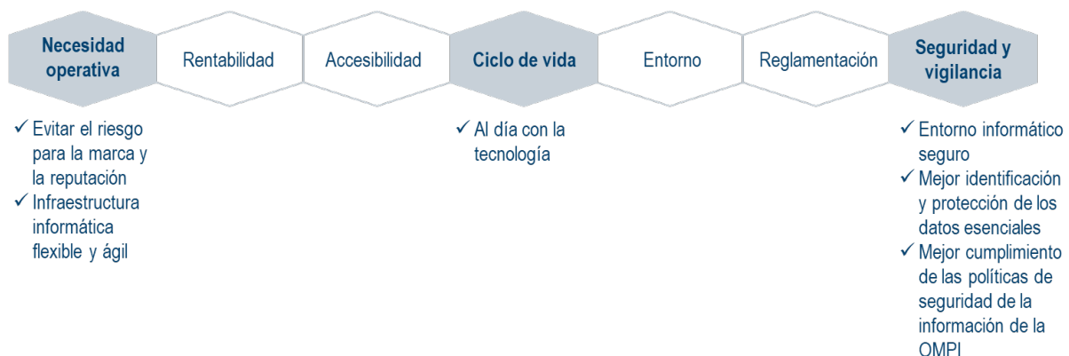
Figura 1: Principales aspectos que justifican la fase híbrida de la plataforma resiliente y segura del PCT

9. Conviene reiterar que las propuestas anteriores son necesarias para evitar que el PCT se quede rezagado con una infraestructura cada vez más antigua y vulnerable. Si no se toma esta decisión, el perfil de riesgo aumentará de medio a alto en el próximo año, lo que iría en contra de la declaración sobre el apetito de riesgo de la OMPI (3.2 - Mejora de la productividad y de la calidad de los sistemas, servicios, conocimientos y datos mundiales de la OMPI en materia de PI (apetito de riesgo: bajo) y 5.2 - Información y comunicación (apetito de riesgo: bajo)). Además, si no se realizan las inversiones propuestas de cara al futuro del sistema PCT, aumentará el riesgo de que se produzca un fallo en la seguridad del sistema PCT, lo que dañaría gravemente la reputación de la OMPI y la confianza en los servicios del PCT.