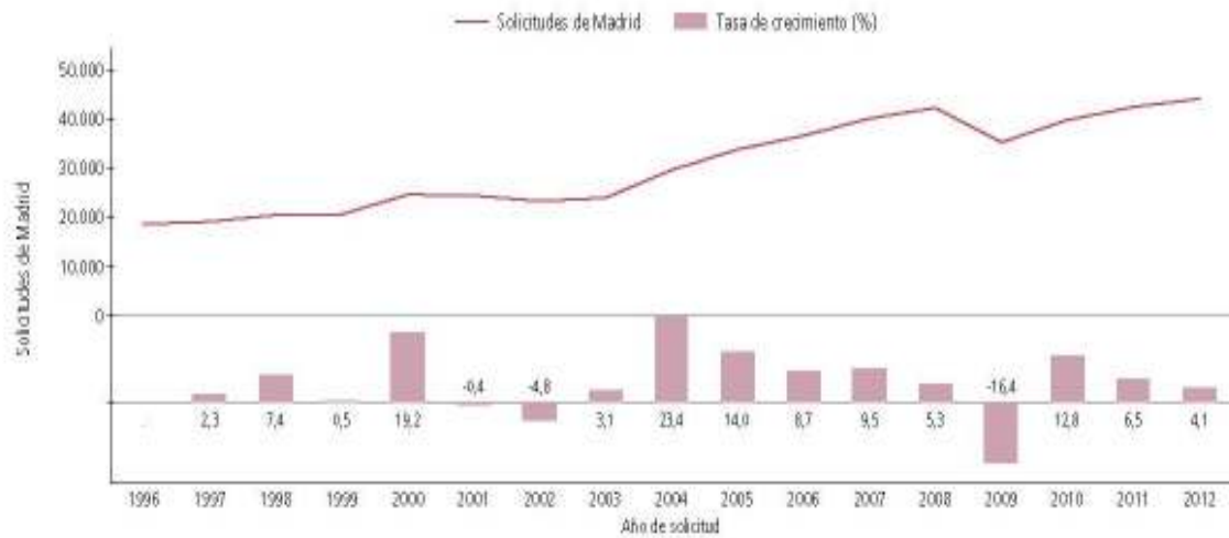
Gráfico 3: Crecimiento de las solicitudes del sistema de Madrid