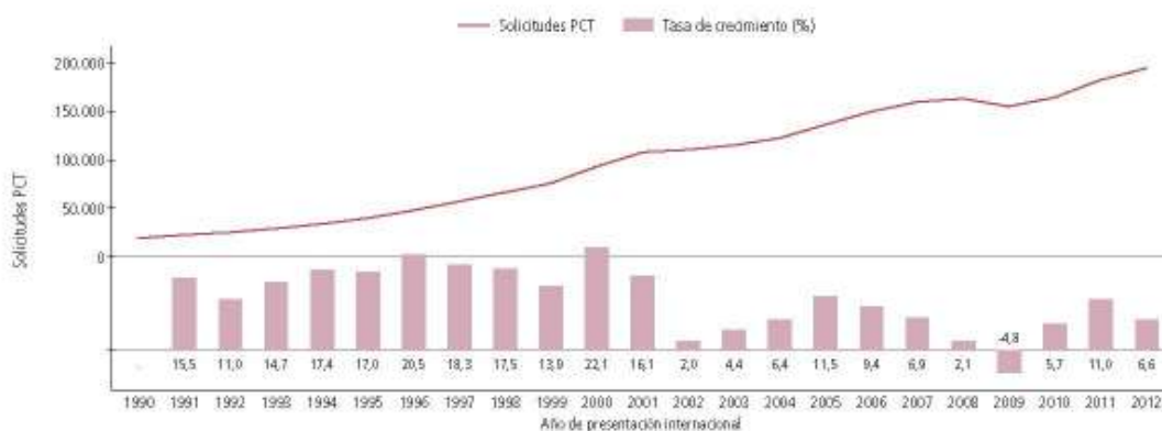
Gráfico 1: Tendencias observadas en la presentación de solicitudes PCT

Nota: Las cifras relativas a 2012 son estimaciones de la OMPI.