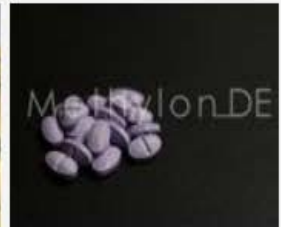
25x 1mg Xanax 0.15106984 BTC