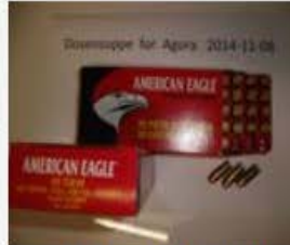
.40S&W - 100 0.50814403 BTC