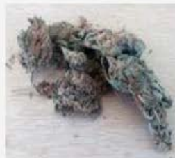
Weed indoor Haze 5g