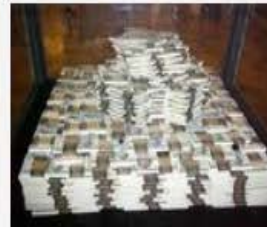
Be a marketer ! - $1000 a 0.57392809 BTC