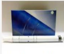
AGO White Dry Herb 0.09613535 BTC