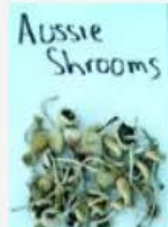
1g Magic Mushrooms - 0.03158733 BTC