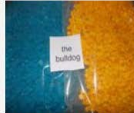
50 pieces of nice bitcoin 0.54934490 BTC