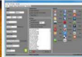
OFFICIAL Account Creator 0.00700000 BTC