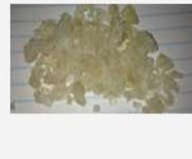
Ethylone Rocks 2000g