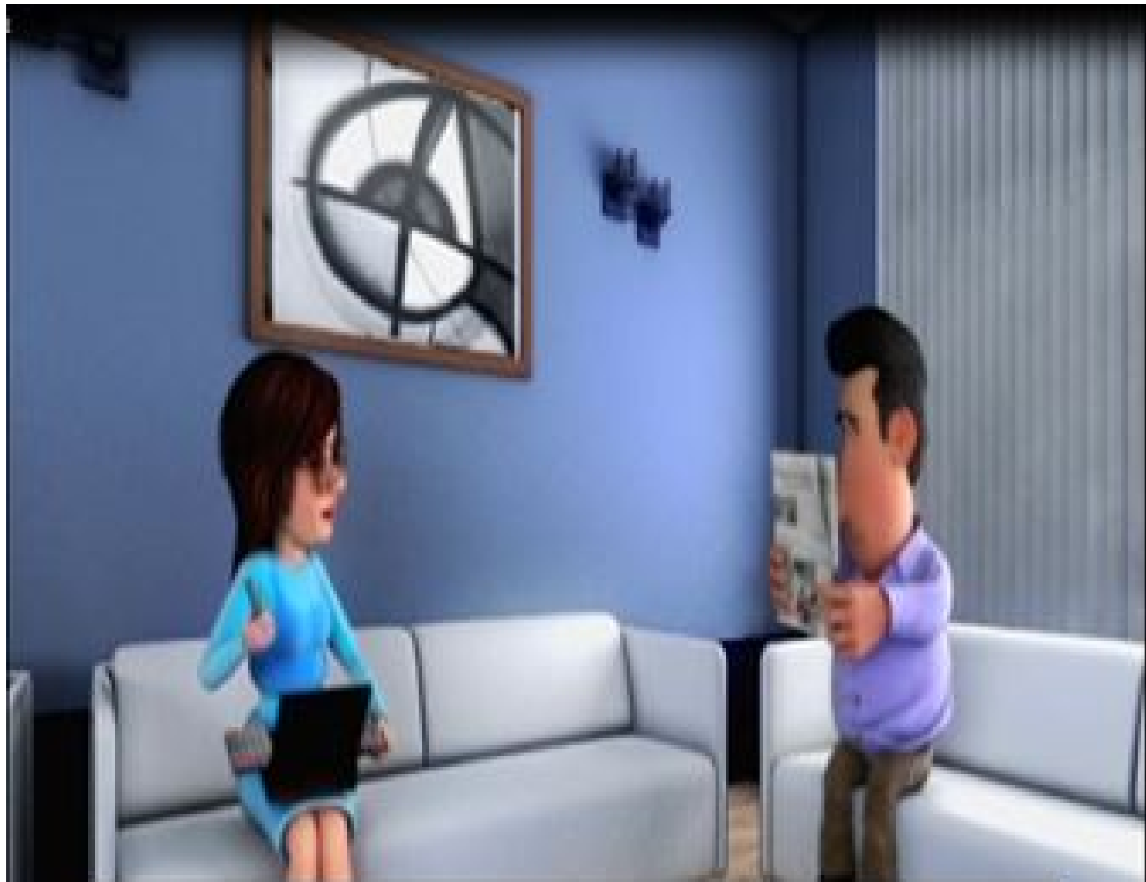
On top, I took a free nose powder to slim it down gracefully