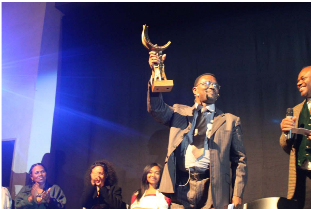
Prix Harubuntu en Belgique