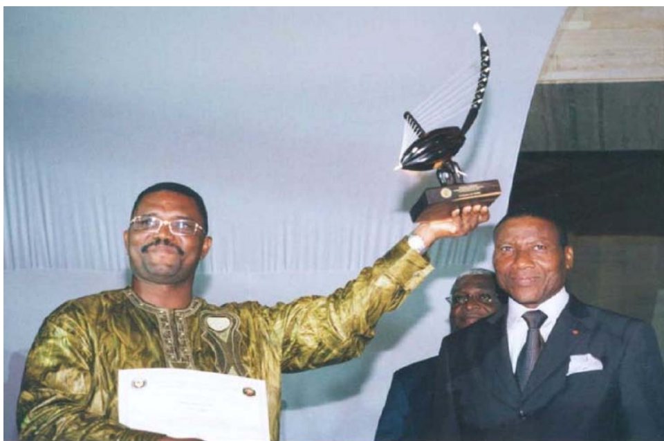
Prix CEDEAO / ECOWAS