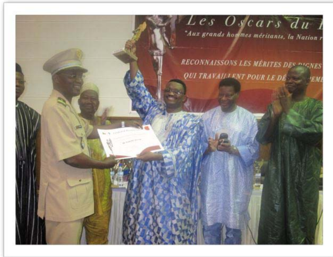
Oscar invention développement Bénin/ Oscar invention development Benin