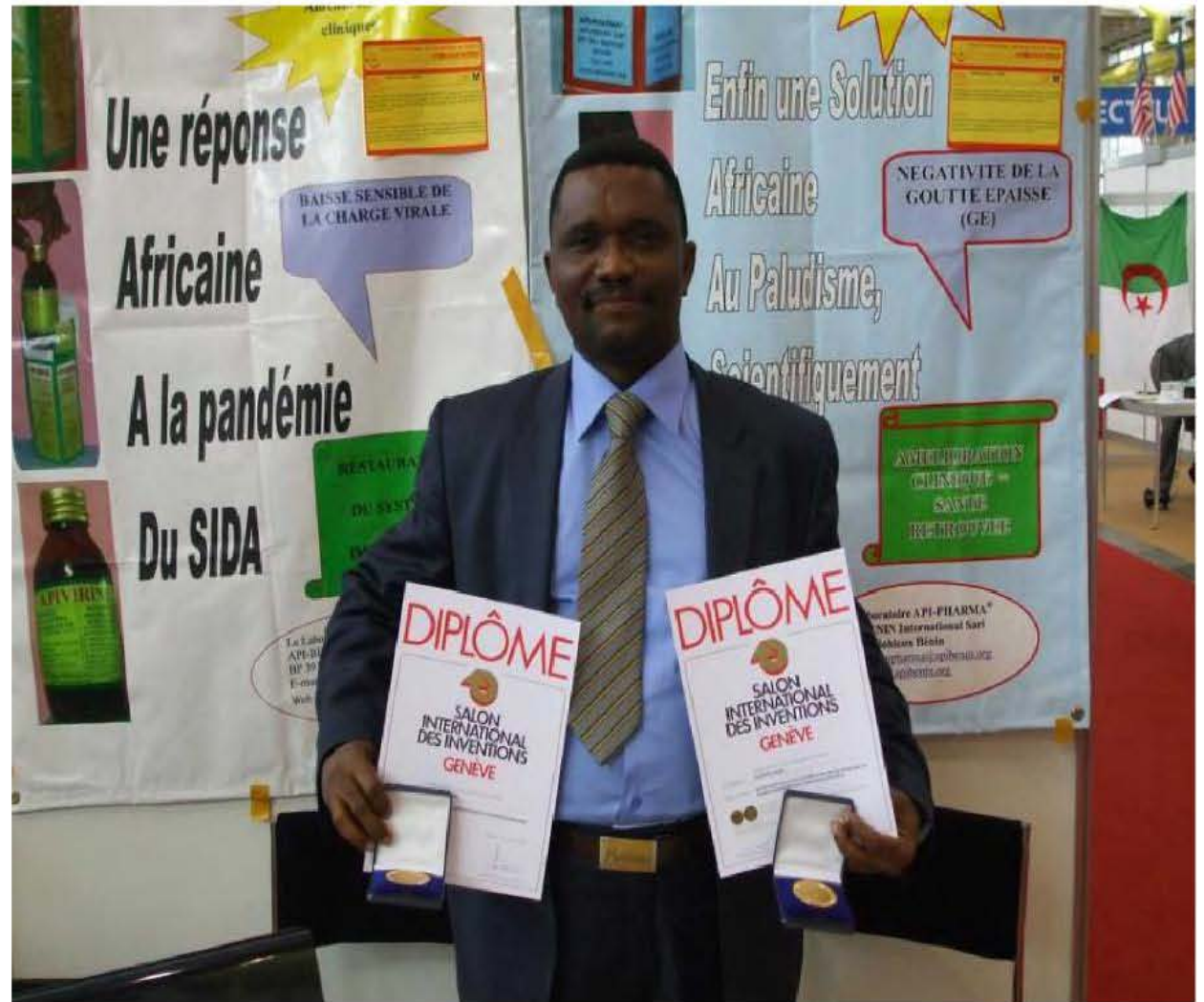
Deux médailles d'or salon invention de Genève, Suisse / Two gold medals lounge invention Geneva , Switzerland