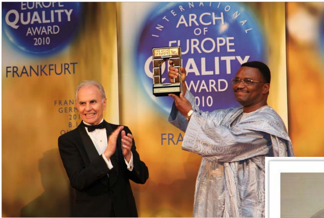
Frankfurt Allemagne / Germany