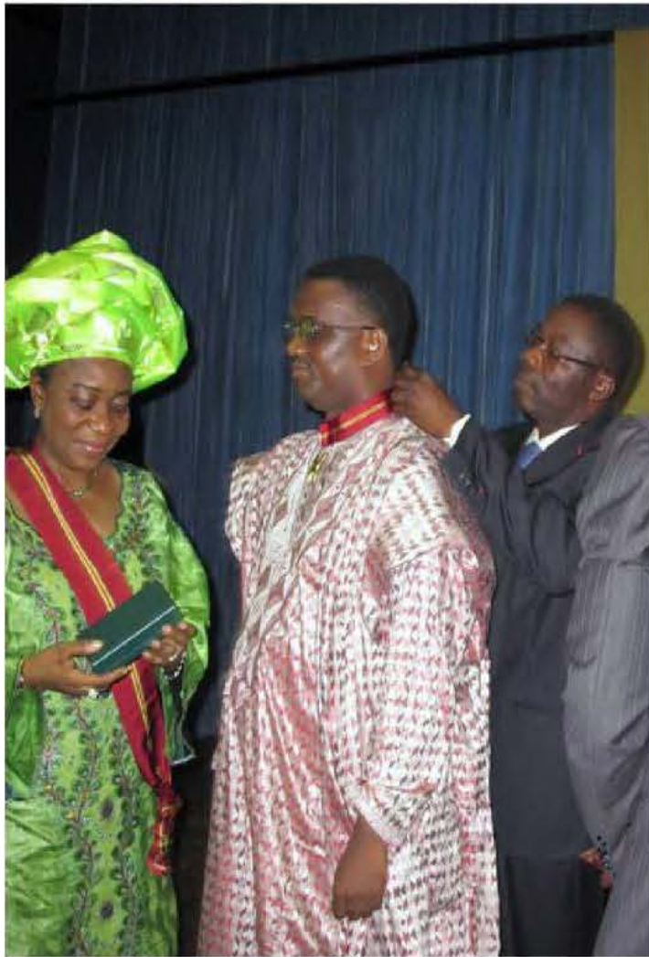
Commandeur de l'ordre national / Commander of the National Order