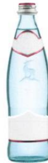
БОРЖОМИ ОБЪЕМНЫЙ ЗНАК № 520558