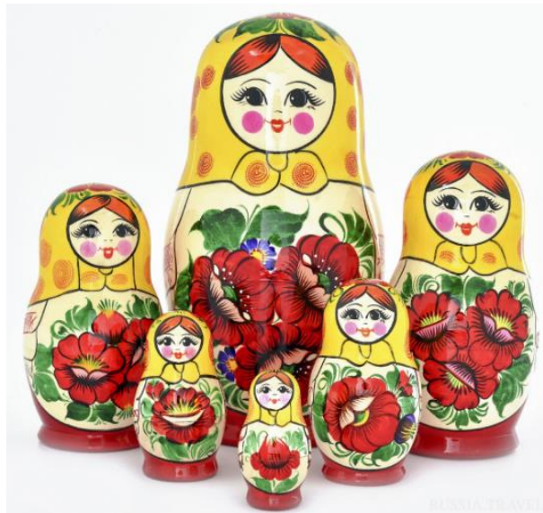
*СЕМЕНОВСКАЯ МАТРЕШКА, НМПТ №220