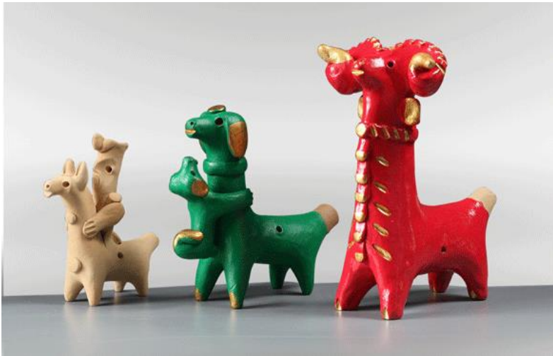
*АБАШЕВСКАЯ ИГРУШКА, НМПТ №209