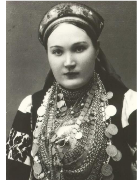
ПРЕДСТАВИТЕЛЬ НАРОДА СЕТУ (СЕТО)**