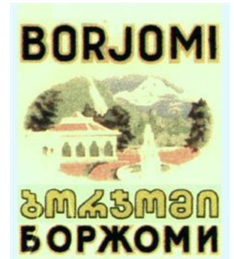
БОРЖОМИ КОЛЛЕКТИВНЫЙ ЗНАК №204325