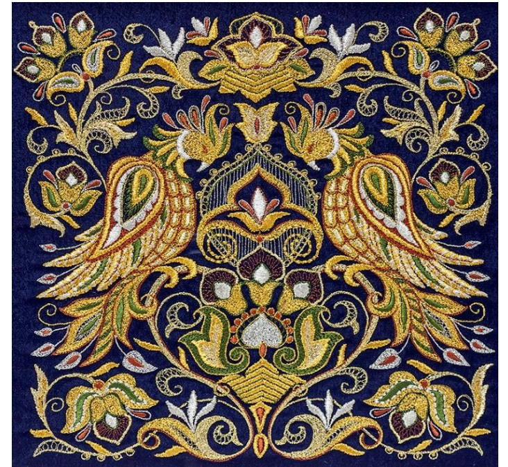
ТОРЖОКСКОЕ ЗОЛОТОЕ ШИТЬЕ, НМПТ №196