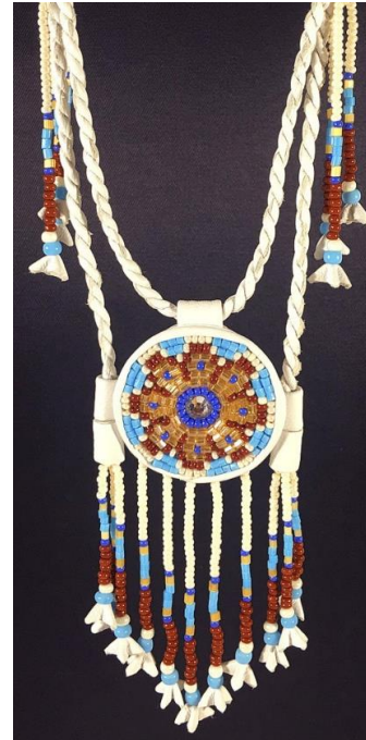
КУЛОН КАМЧАТСКИЙ, НМПТ №186