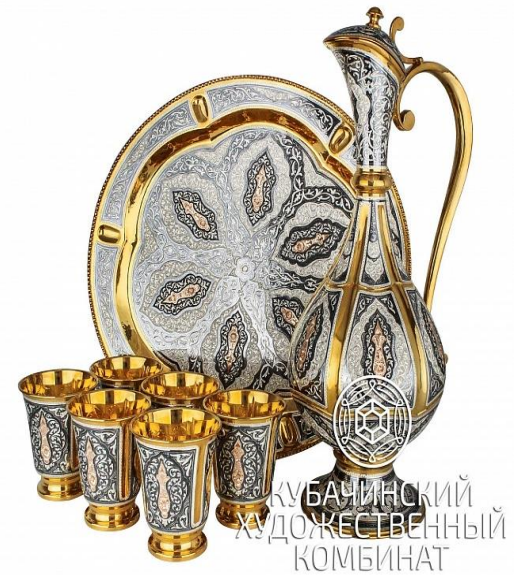
*КУБАЧИ, НМПТ №243

* Источники: https://rospatent.gov.ru/ru/sourses/regional-brands/folk-crafts/abashevskaya-igrushka ; https://russia.travel/objects/314496 ; https://kybachi.ru/cat/product/64037/