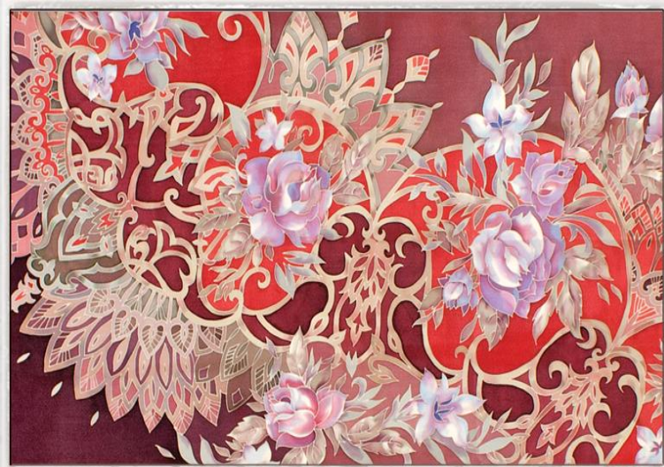
ТРОИЦКИЙ ПЛАТОК, ГЕОГРАФИЧЕСКОЕ УКАЗАНИЕ № 263