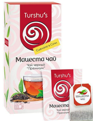
МАЕСТА ЧАЙ, ГЕОГРАФИЧЕСКОЕ УКАЗАНИЕ № 261