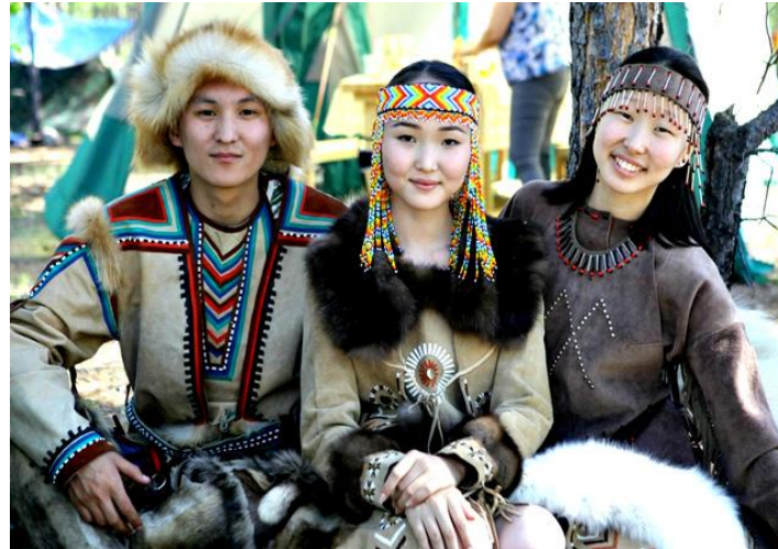
ПРЕДСТАВИТЕЛИ НАРОДА ЭВЕНКИ*