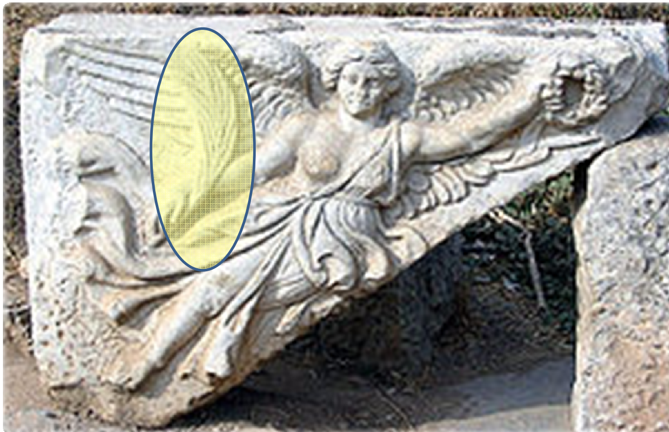
האלה ניקה - כף תמר וזר ניצחון בידה