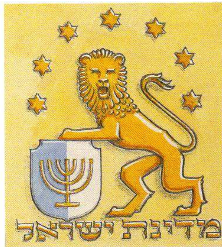
הצעה לסמל המדינה -ינושוי-