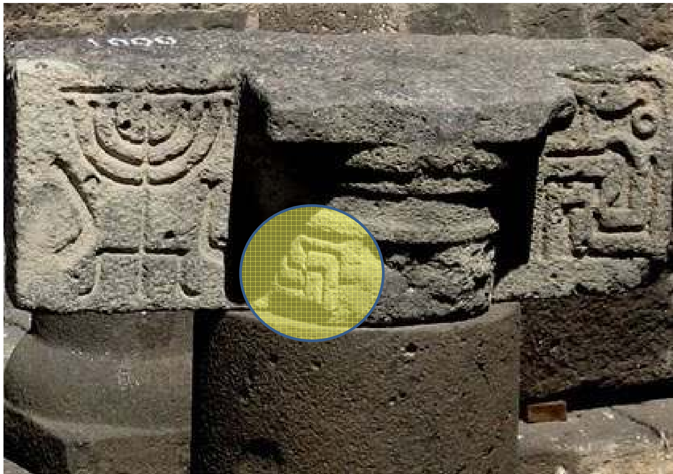
מנורה לצד צלב קרס בבית הכנסת אום אל קנטיר ברמת הגולן