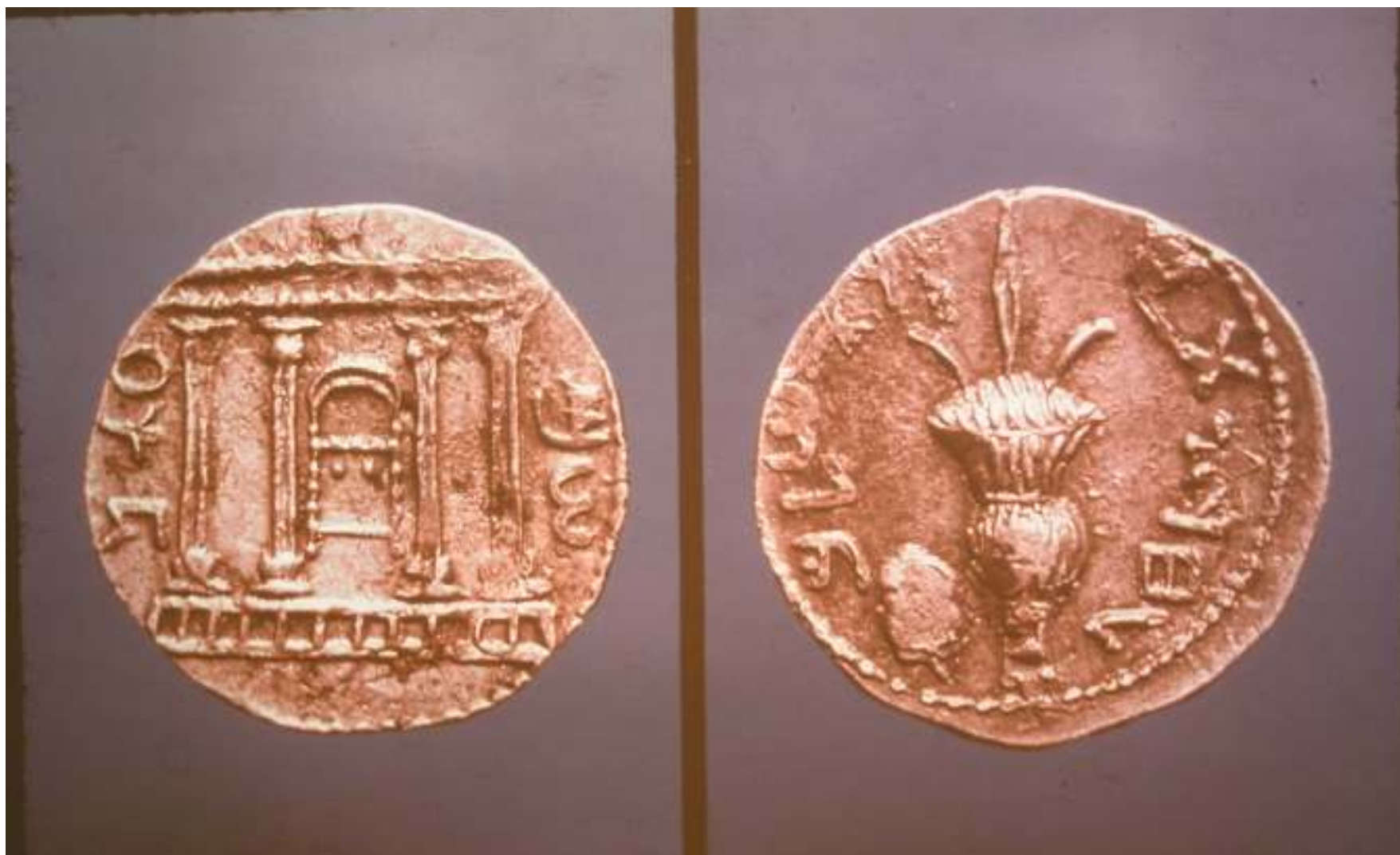
לחרות ירושלים // שמ עון - מרד בר כוכבא 135 לס'