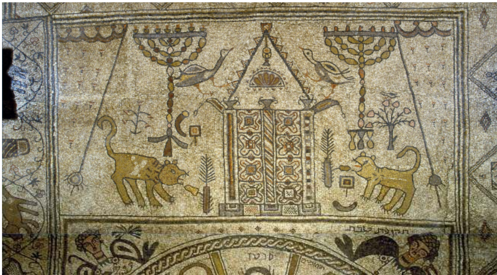
לולב שופר ומנורה – בית כנסת בית אלפא מאה 6 לס'