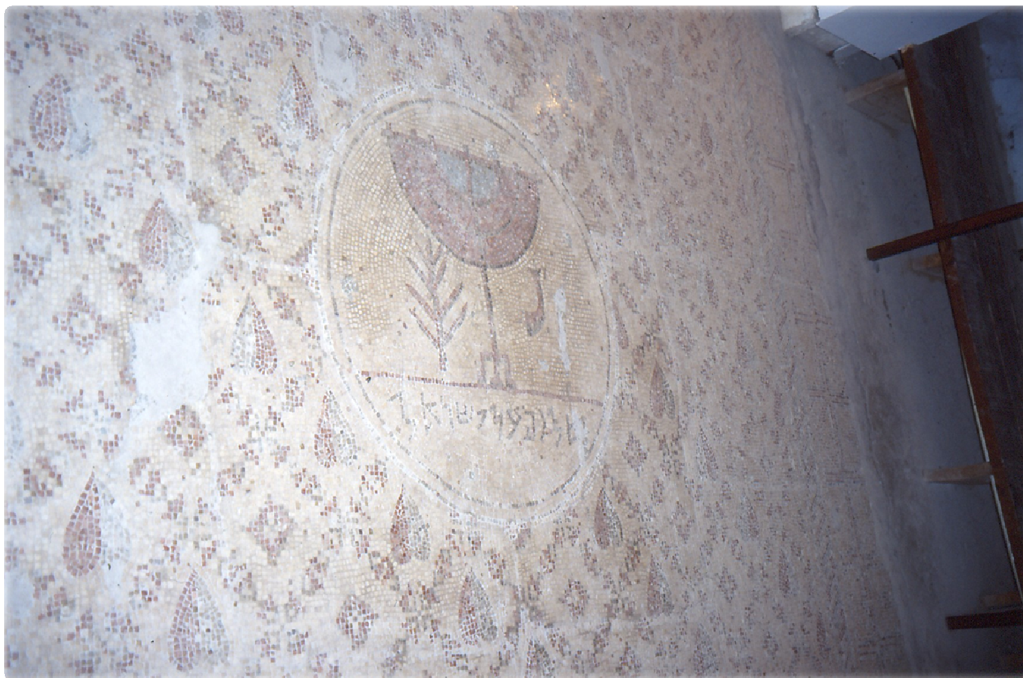
לולב שופר ומנורה – בית כנסת שלום על ישראל יריחו