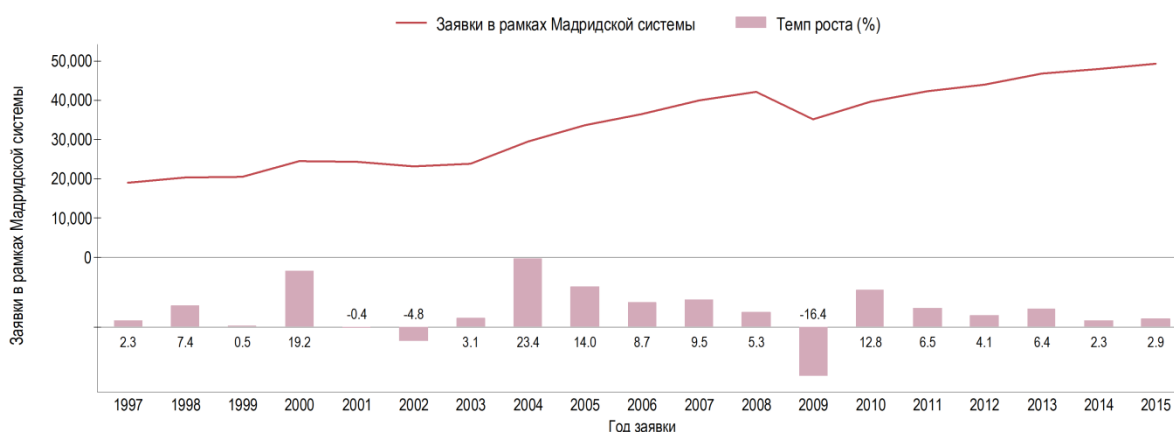
Диаграмма А.1.1 Динамика подачи международных заявок