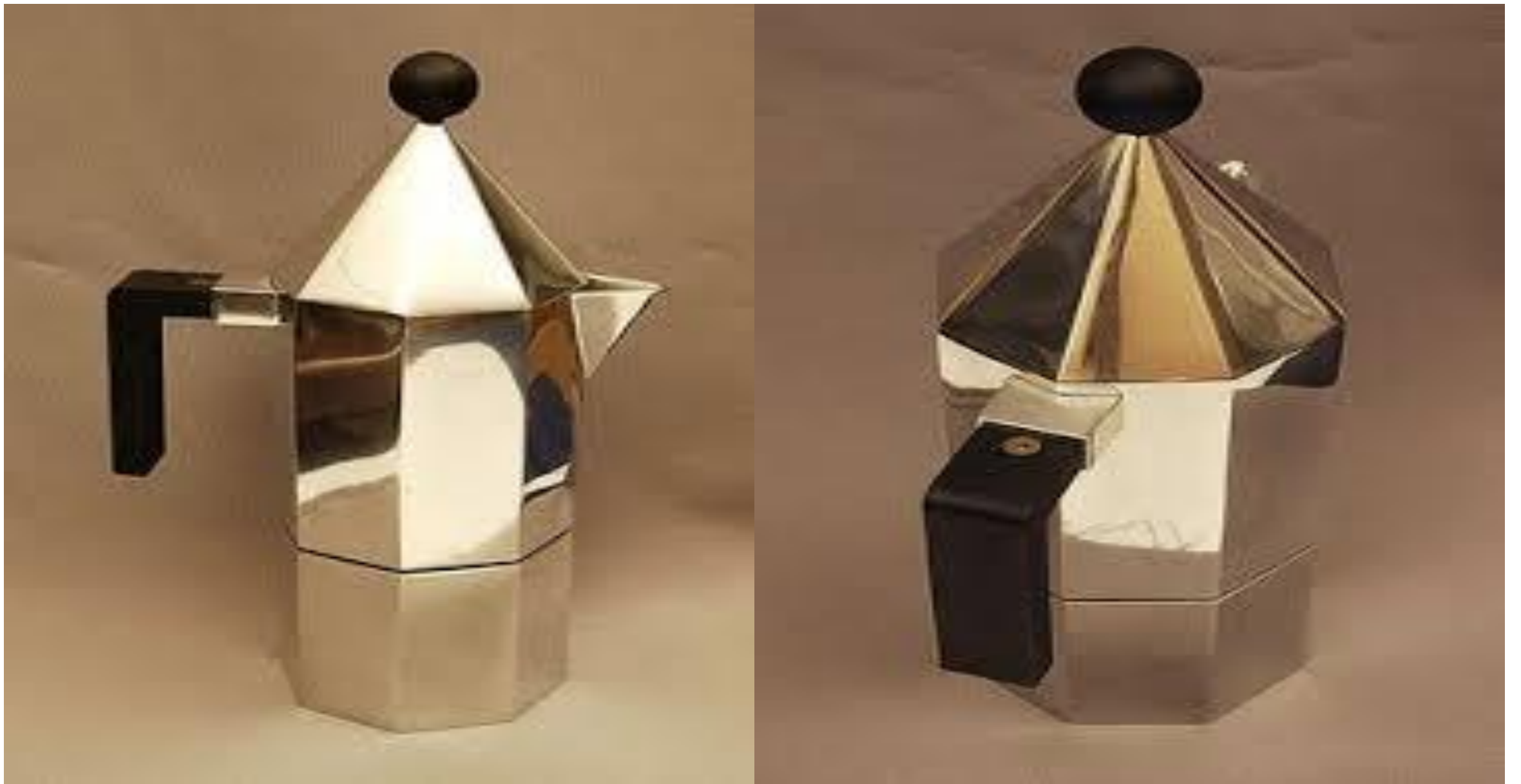
DM/022 932 no 3.1 et 3.2