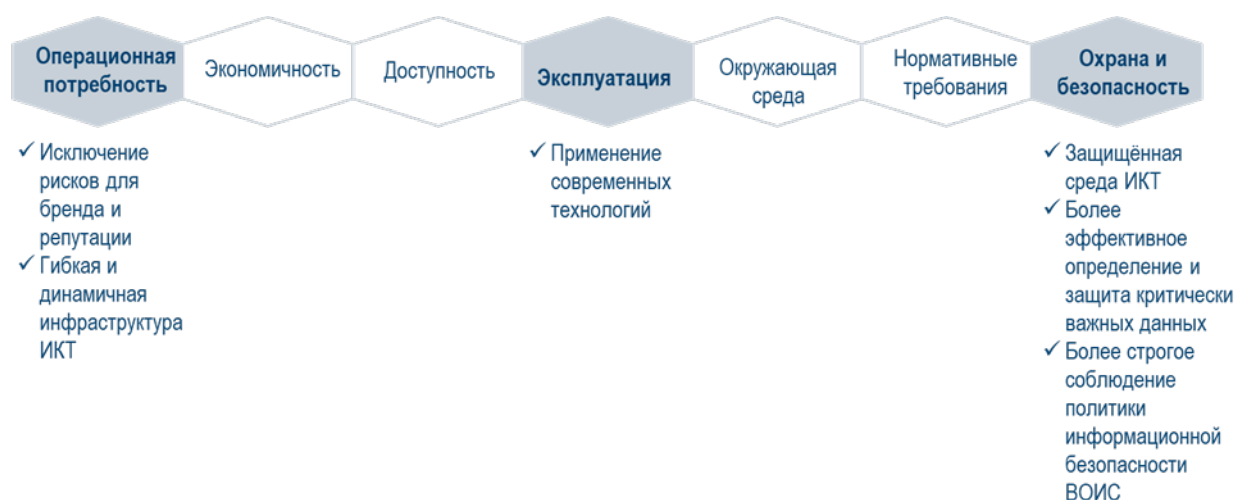
Диаграмма 1. Основные критерии отбора гибридного этапа проекта ОЗП РСТ