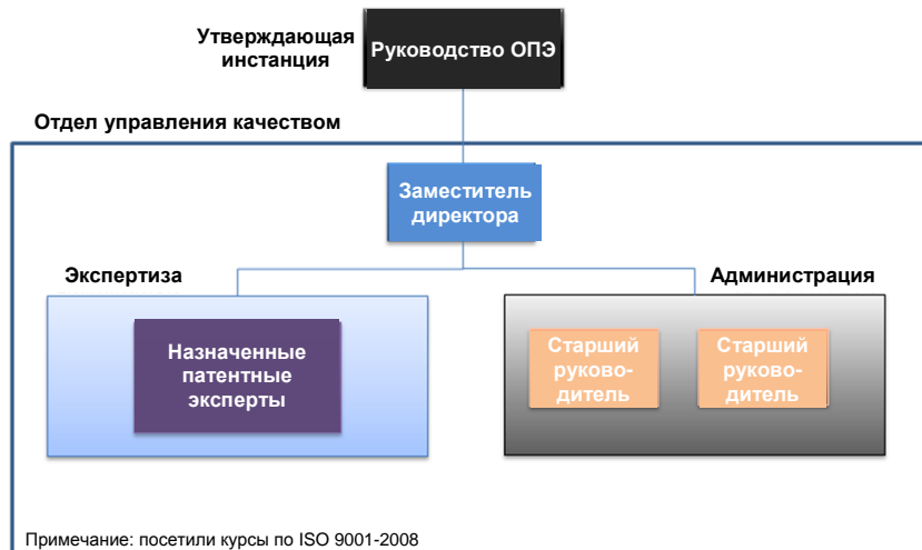
Иллюстрация 1. Организационная структура отдела управления качеством ОПЭ

21.05 Укажите (например, в таблице), насколько СУК, существующая в патентном ведомстве, отвечает требованиям главы 21 правил международного патентного поиска и предварительной экспертизы. В противном случае укажите, какие требования еще не выполнены Органом.