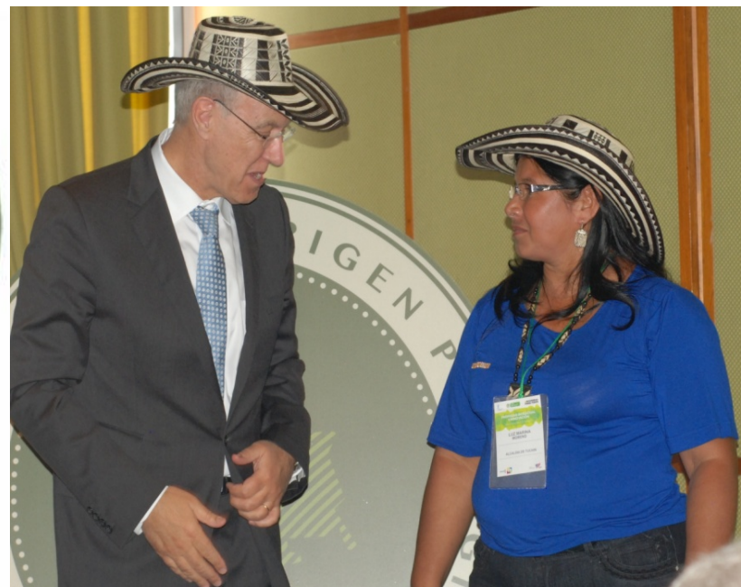
*Francis Gurry Director General of the WIPO.