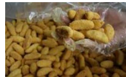
Huila Achira's biscuits