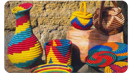
Guacamayas Sisal weaving