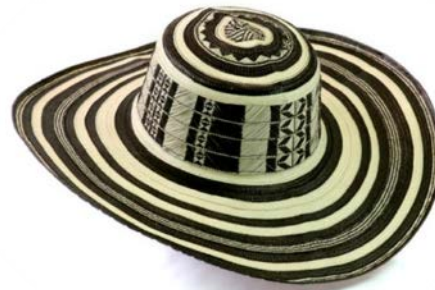
Zenú's weaving "Vueltaio" Hats