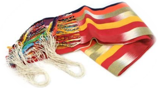
San Jacinto's hammocks