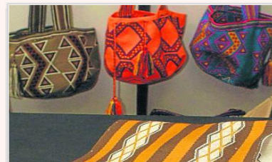
Las mochilas wayúú tendrán denominación de origen.