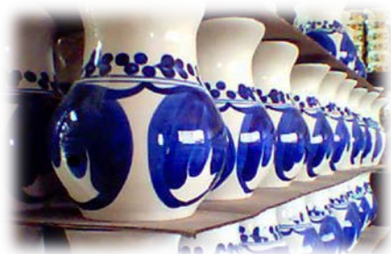
Carmen de Viboral's Ceramic